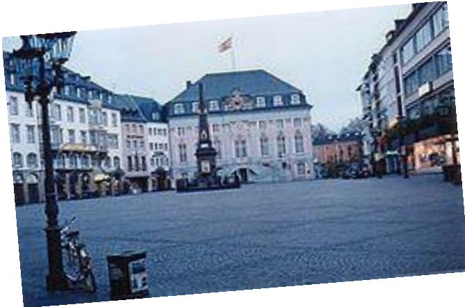
Il centro di Bonn- das Zentrum von Bonn

L'azienda di dolci tedesca Haribo-Holding GmbH & Co. KG, nel quartiere Kessenich.