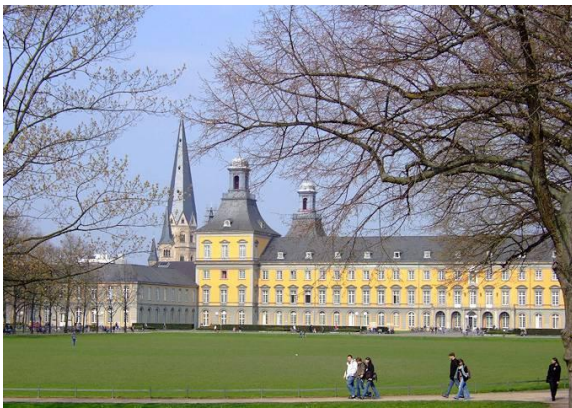
L'università di Bonn- Die Universität von Bonn