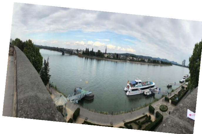
Bonn sul Reno- Bonn am Rhein