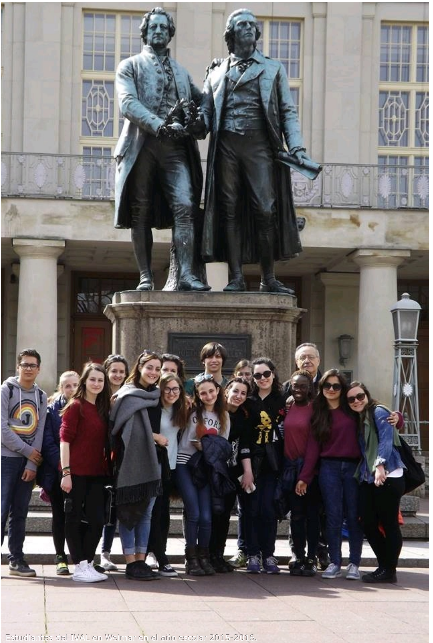
Estudiantes del IVAL en Weimar en el año escolar 2015-2016.