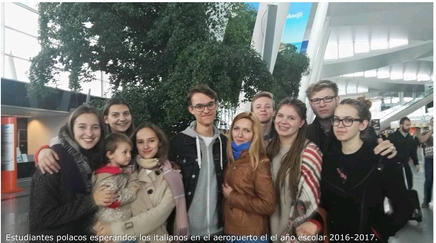
Estudiantes polacos esperando los italianos en el aeropuerto el el año escolar 2016-2017.

Wrocław es la ciudad más grande en el oeste de Polonia. Es la capital histórica de Silesia y Baja Silesia. Hoy en día, es la capital de la Baja Silesia.