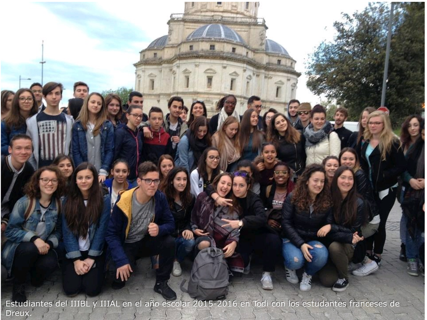
Estudiantes del IIIBL y IIIAL en el año escolar 2015-2016 en Todi con los estudiantes franceses de Dreux.