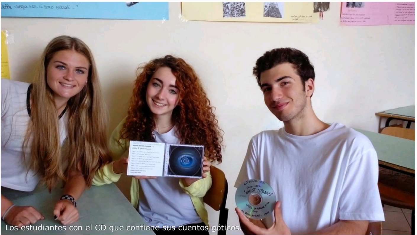
Los estudiantes con el CD que contiene sus cuentos góticos.