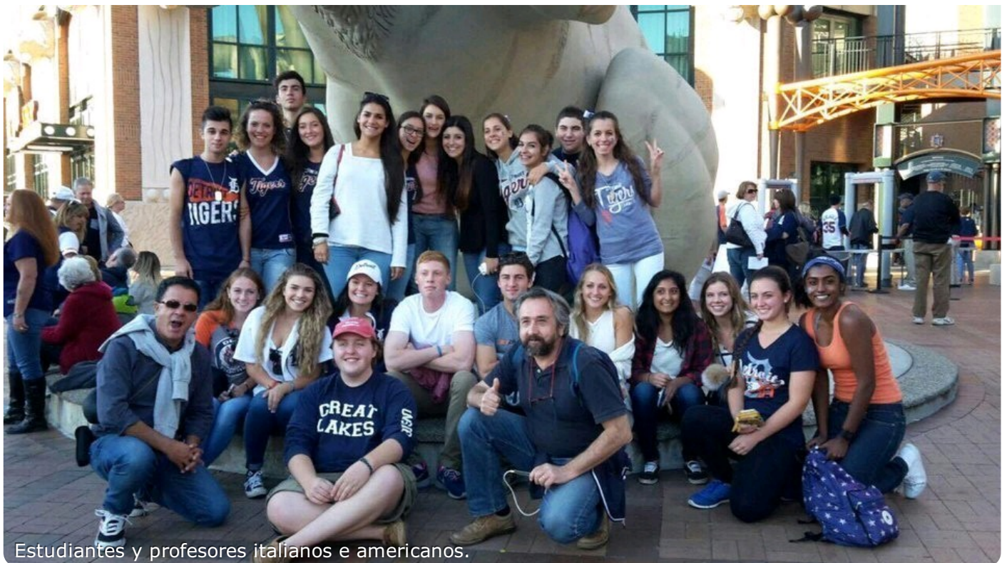
Estudiantes y profesores italianos e americanos.

Detroit es la ciudad más poblada en el estado de EE.UU. de Michigan, la cuarta ciudad más grande en el Medio Oeste y la ciudad más grande en los Estados-Canada Border Unidas.