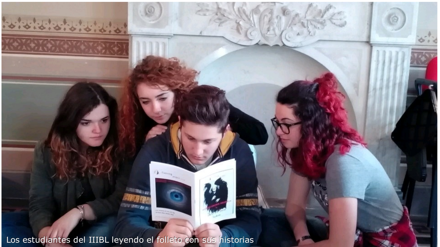
Los estudiantes del IIIBL leyendo el folleto con sus historias