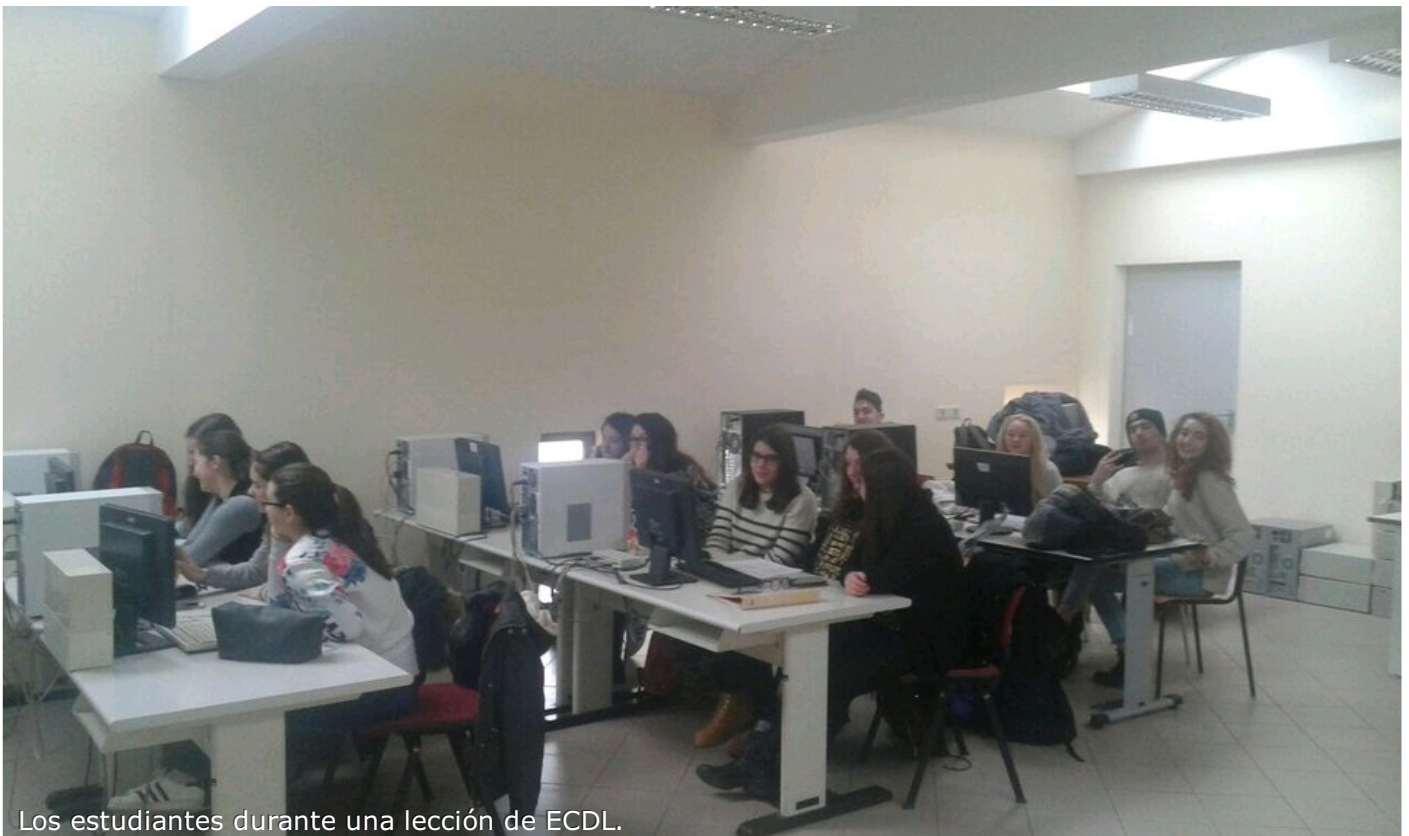
Los estudiantes durante una lección de ECDL.

"European Computer Driving License" es un certificado internacional que comprueba la capacidad del estudiante a trabajar de forma independiente en el ordenador. La escuela ofrece la oportunidad al alumno de seguir lecciones para prepararse a los siete exámenes que tiene que pasar para conseguir el certificado.