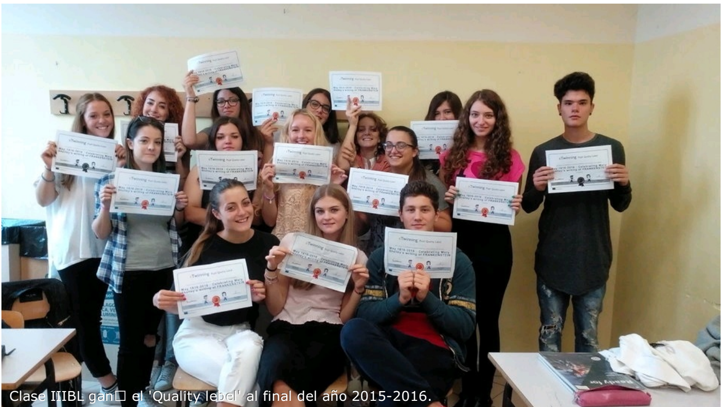
Clase IIIBL ganó el "Quality label" al final del año 2015-2016.

Es un intercambio electrónico que permite al alumno escribir en inglés para comunicarse con otros estudiantes europeos para elaborar un proyecto. E-Twinning nació en enero de 2005 y nuestra escuela participó con tres proyectos ganando 2 premios.