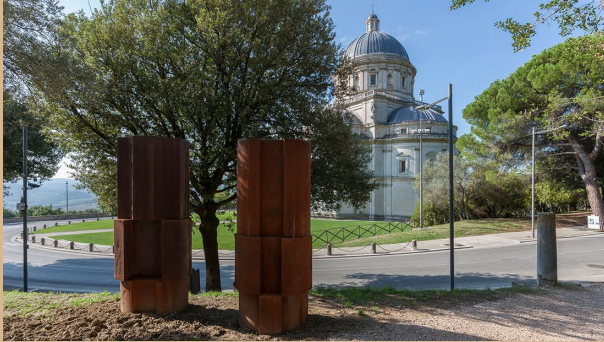
"SAN MARTINO ALTARS", 1993