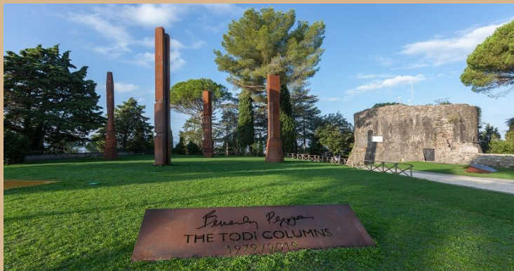
“THE TODI COLUMNS”, 2018

Le 1979 a été une année décisive pour Pepper. Acclamée désormais au niveau international parmi les plus grands sculpteurs du son temps, il a tourné son attention vers sa ville d'adoption adorée, Todi, et pour le centre historique médiévale de la ville, a créé quatre monuments totémiques. Ces sculptures ont transformé physiquement la place et l'histoire de la sculpture contemporaine. Les colonnes font 13 mètres de haut.