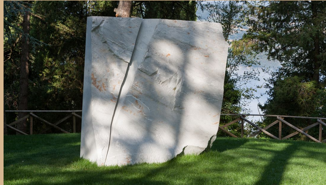
"ACTIVATED PRESENCE", 2001