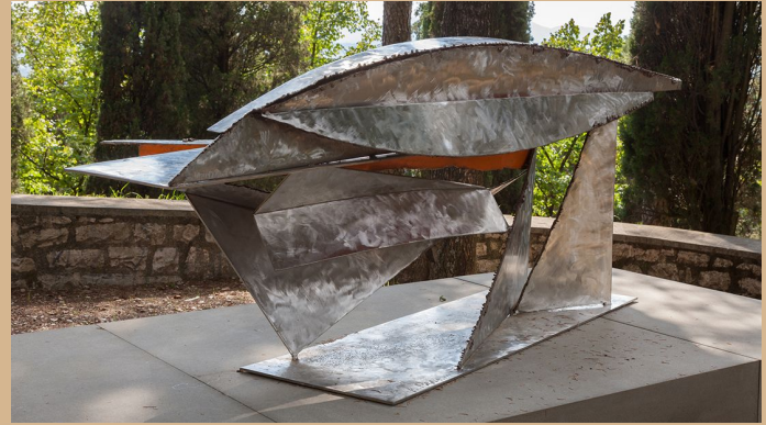
"LA BESTIA", 1965